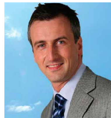
Alessandro Fermi Presidente dell'VIII Commissione

La proposta di modifica della FMI alla legge e l'intervista al Presidente dell'VIII Commissione, Alessandro Fermi