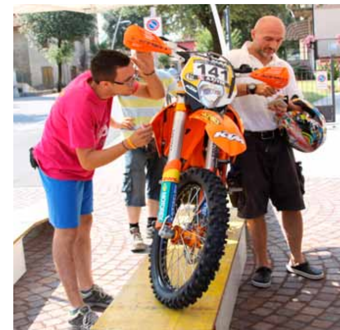
Testo: Monica Mori