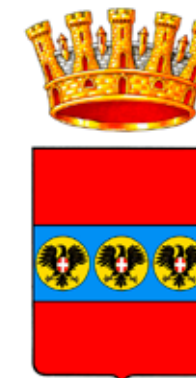
COMUNE DI IGLESIAS